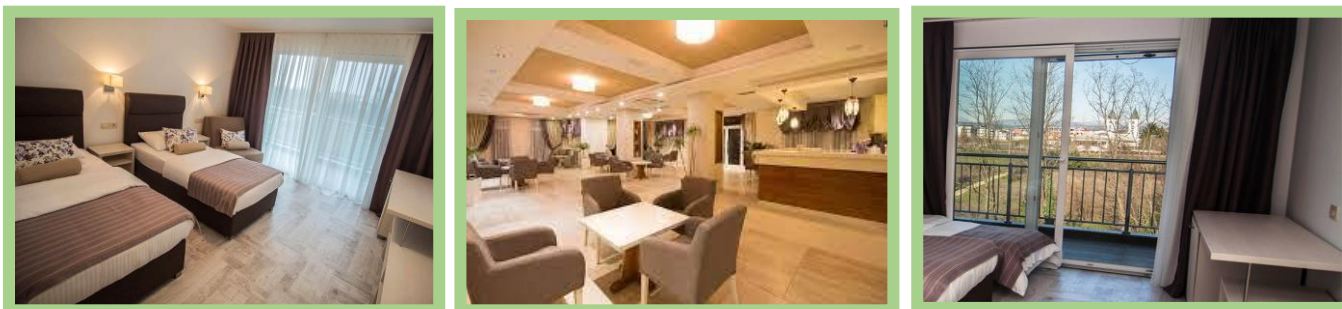
Hôtel Lavanda à Medjugorje.

Après un bon déjeuner buffet, en route en autobus vers l'aéroport de Barcelone (trajet de 25 minutes). Vol direct à destination de Dubrovnik. Un repas panier est prévu pour le repas du midi que vous allez pouvoir déguster pendant le voyage en autobus vers Medjugorje (trajet de 2h30). Arrivée à Medjugorje vers 17h00. Installation pour 9 nuitées dans l'un des meilleurs hôtels de Medjugorje situé à seulement 3 minutes de marche de l'église. De catégorie 4 étoiles selon les standards de la Bosnie Herzégovine. Ça peut être comparé à un hôtel de 3 1/2 étoiles selon les standards du Canada. Hôtel Lavanda : https://lavandamedjugorje.com/ Première soirée de prière au sanctuaire suivi du souper au restaurant.