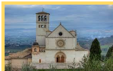
Tombeau du bienheureux Carlo Acutis et la Basilique Saint François d'Assise.