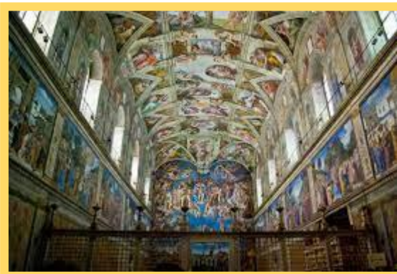
Audience publique et chapelle Sixtine.