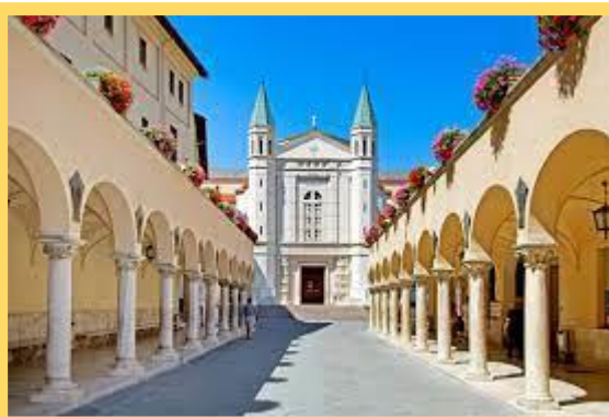
Tombeau de sainte Rita et la basilique Sainte Rita de Cascia.