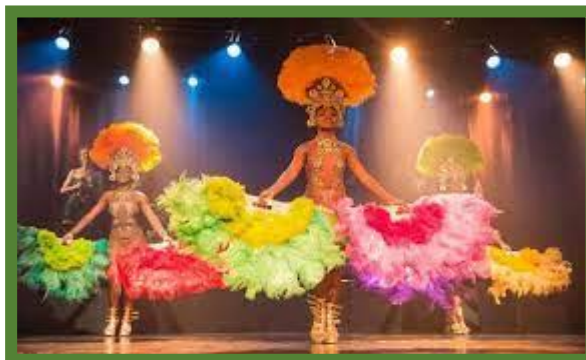
Spectacle Ginga Tropicale.