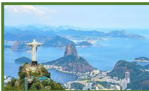
Le Christ Rédempteur sur Corcovado.