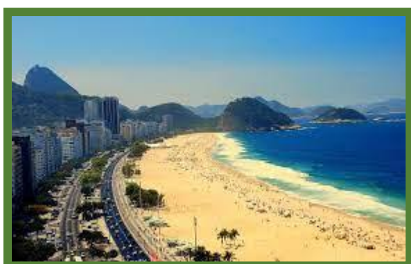
La plage de Copacabana

Repas inclus : Déjeuner, dîner et souper.