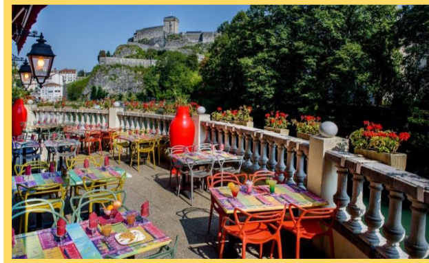
Hôtel La Solitude, Lourdes.